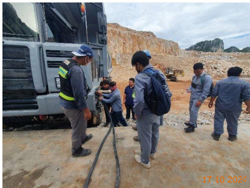
รูปที่ 2-37 การอบรมวิธีการทำงาน ของเครื่องจักรกลและอุปกรณ์แต่ละประเภท ให้แก่พนักงาน