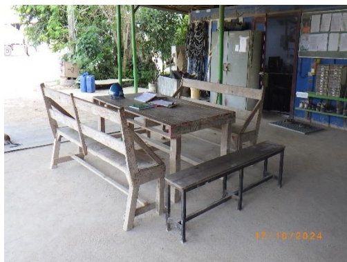
รูปที่ 2-20 บริเวณพักผ่อนสำหรับพนักงาน