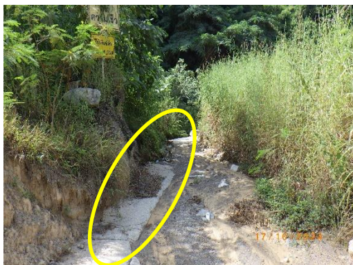
รูปที่ 2-39 คูระบายน้ำ บริเวณพื้นที่โครงการ