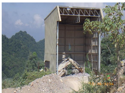
รูปที่ 2-27 เครื่องย่อยหินปูน (Limestone Crusher)