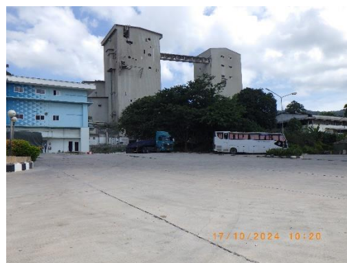
รูปที่ 2-32 ถนนคอนกรีตเสริมเหล็ก บริเวณเส้นทางขนส่งหลัก