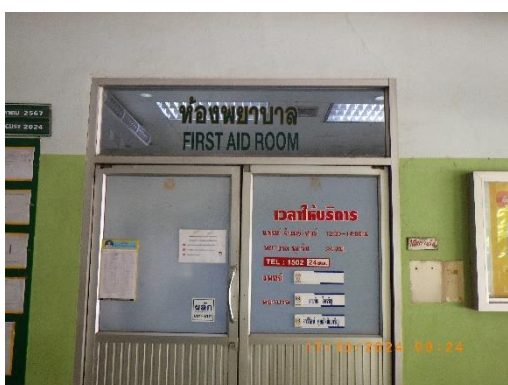
รูปที่ 2-15 ห้องพยาบาลและรถพยาบาลฉุกเฉิน