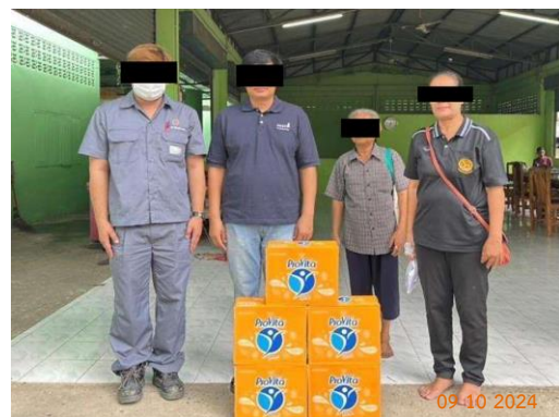
รูปที่ 2-22 (ต่อ) สนับสนุนกิจกรรมชุมชน