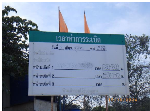
รูปที่ 2-6 ป้ายแจ้งวัน-เวลาระเบิด

ของบริษัท ทีพีโอ โพลีน จำกัด (มหาชน) ระหว่างเดือนกรกฎาคม-ธันวาคม พ.ศ. 2567