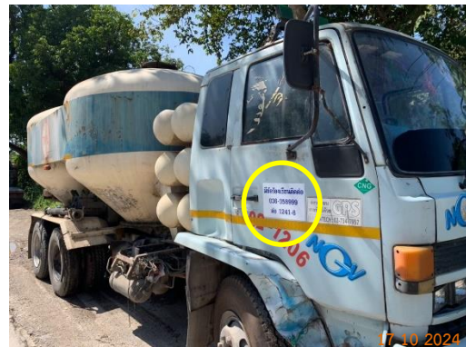
รูปที่ 2-38 เบอร์โทรศัพท์ หรือรายละเอียด ที่สามารถแจ้งข้อร้องเรียนที่เห็นชัดเจน ข้างรถบรรทุกแร่ของโครงการ