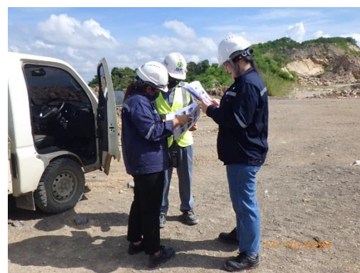
รูปที่ 2-26 การติดตามตรวจสอบตามมาตรการ ป้องกันและแก้ไขผลกระทบสิ่งแวดล้อม