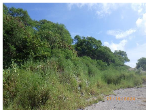
รูปที่ 2-9 แนวต้นไม้ ในแนวเขตเว้นการทำเหมือง