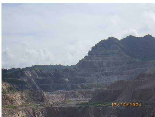
รูปที่ 2-2 ลักษณะการทำเหมืองแบบขั้นบันได เหมืองแร่หินปูน