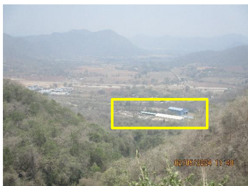
รูปที่ 2-8 ขอบเขตสุดท้ายของหน้าเหมือง ห่างจากเส้นทางรถไฟสายตะวันออกเฉียงเหนือ