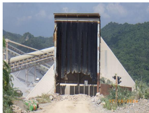
รูปที่ 2-30 เครื่องฉีดพ่นน้ำในลักษณะของม่านน้ำ บริเวณลานกองวัตถุดิบ