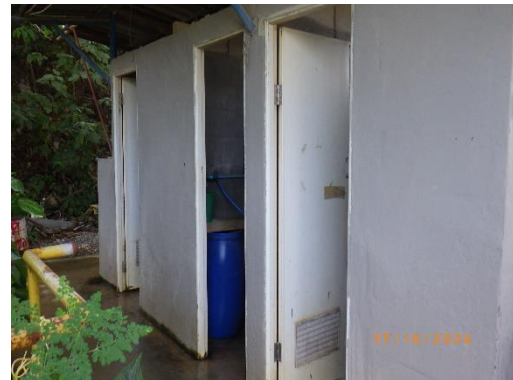
รูปที่ 2-17 ห้องน้ำภายในบริเวณโครงการ