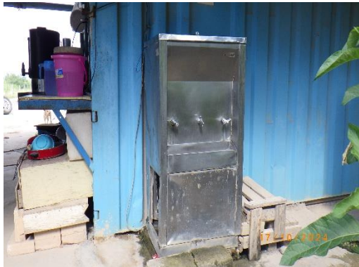
รูปที่ 2-16 ถังสำรองน้ำดื่มในพื้นที่สำนักงาน

ของบริษัท ทีพีโอ โพลีน จำกัด (มหาชน) ระหว่างเดือนกรกฎาคม-ธันวาคม พ.ศ. 2567