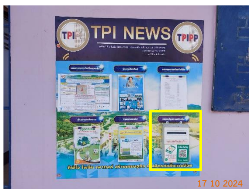
รูปที่ 2-45 รูปกล่องรับเรื่องร้องเรียน 14 หมู่บ้าน