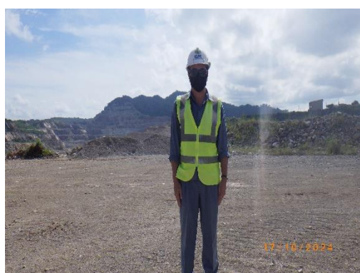
รูปที่ 2-14 การสวมใส่อุปกรณ์ป้องกันอันตราย ส่วนบุคคลของพนักงาน