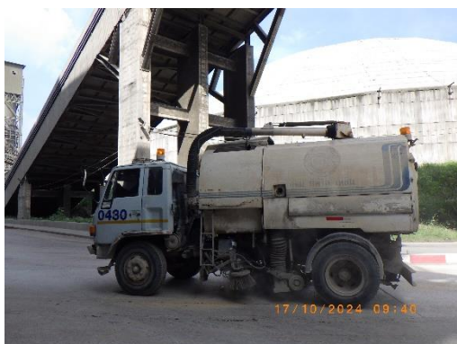
รูปที่ 2-31 รถดูดฝุ่นทำความสะอาดฝุ่น บริเวณพื้นที่โครงการ