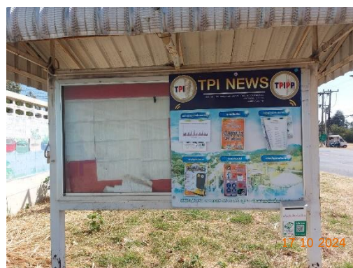
รูปที่ 2-36 (ต่อ) การประชาสัมพันธ์ข้อมูลเกี่ยวกับการดำเนินงานของโครงการ บริเวณชุมชนใกล้เคียงและหน่วยงานสาธารณสุขในพื้นที่

บริษัท ยูไนเต็ต แอนนาลิสต์ แอนด์ เอ็นจิเนียริง คอนซัลแตนท์ จำกัด