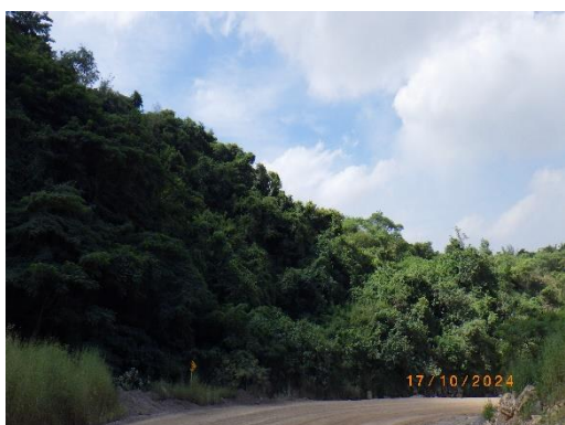
รูปที่ 2-25 ปลุกไม้ยืนต้นโตเร็ว ประจำถิ่นเพิ่มเติม