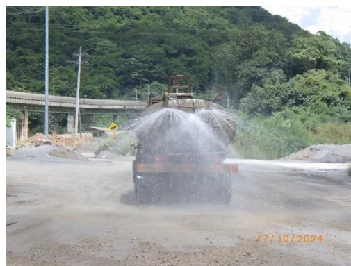
รูปที่ 2-12 การฉีดพรมน้ำบริเวณเส้นทางขนส่งแร่