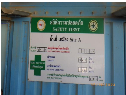
รูปที่ 2-18 ประกาศด้านความปลอดภัย ในพื้นที่เหมือง