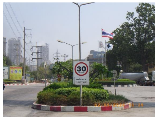
รูปที่ 2-24 ป้ายควบคุมความเร็ว บริเวณพื้นที่โครงการ