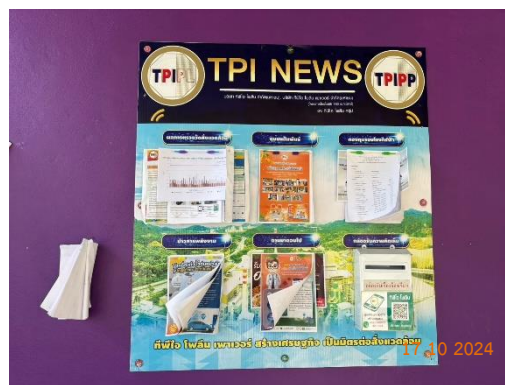
รูปที่ 2-36 การประชาสัมพันธ์ข้อมูลเกี่ยวกับการดำเนินงานของโครงการ บริเวณชุมชนใกล้เคียงและหน่วยงานสาธารณสุขในพื้นที่