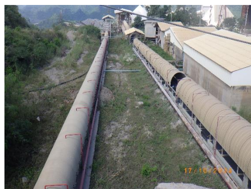
รูปที่ 2-28 ระบบ Bag Filter จุดถ่ายโอนต่างๆของสายพานลำเลียง