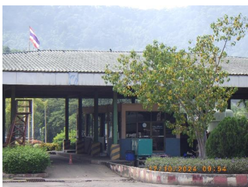
รูปที่ 2-33 เครื่องชั่งน้ำหนัก บริเวณประตูที่ 3