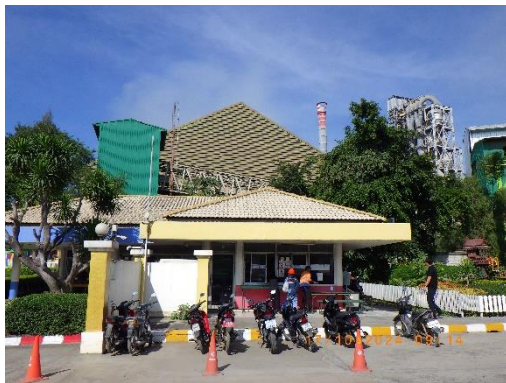
รูปที่ 2-21 อาคารติดต่อและรับเรื่องรื้อรื้อทุกซ์ ของบริษัท

ของบริษัท ทีพีโอ โพลีน จำกัด (มหาชน) ระหว่างเดือนกรกฎาคม-ธันวาคม พ.ศ. 2567