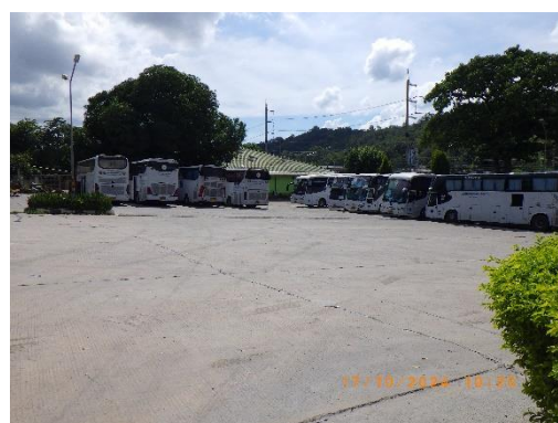
รูปที่ 2-34 ลานจอดรถบรรทุก บริเวณโรงงานปูนซีเมนต์