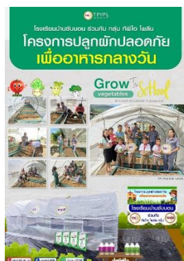
รูปที่ 2-41 สนับสนุนกิจกรรม ภายในโรงเรียนบ้านซับบอน