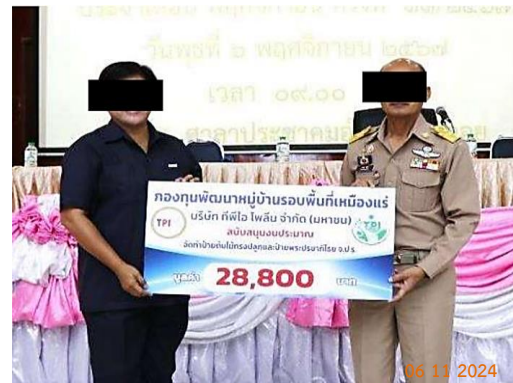
รูปที่ 2-22 สนับสนุนกิจกรรมชุมชน