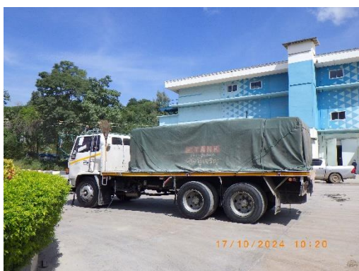
รูปที่ 2-13 ผ้าใบปิดคลุมรถขณะขนส่งแร่