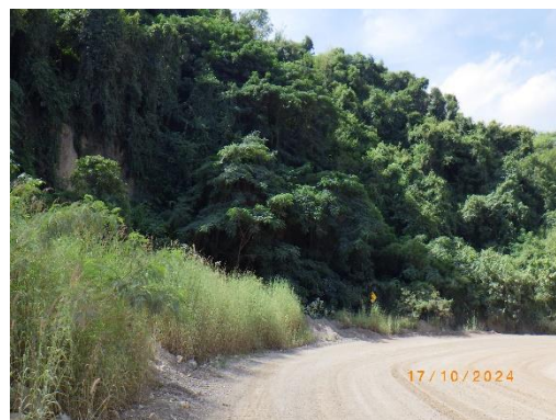
รูปที่ 2-44 ไม้คลุมดินบริเวณพื้นที่โครงการ