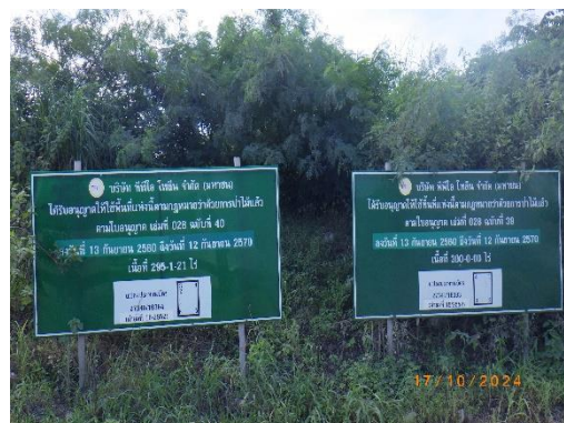
รูปที่ 2-7 ป้ายแสดงแนวขอบเขตการทำเหมือง