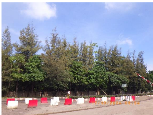
รูปที่ 2-29 ปกไม้ยืนต้นขนาดใหญ่ บริเวณขอบเขตพื้นที่โครงการที่ต่อเนื่องกับ โรงเรียนบ้านซับบอน

ของบริษัท ทีพีโอ โพลีน จำกัด (มหาชน) ระหว่างเดือนกรกฎาคม-ธันวาคม พ.ศ. 2567