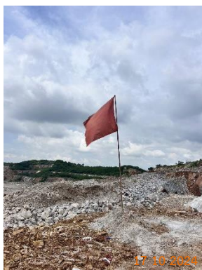
รูปที่ 2-4 ธงแสดงตำแหน่งหลุมเจาะ