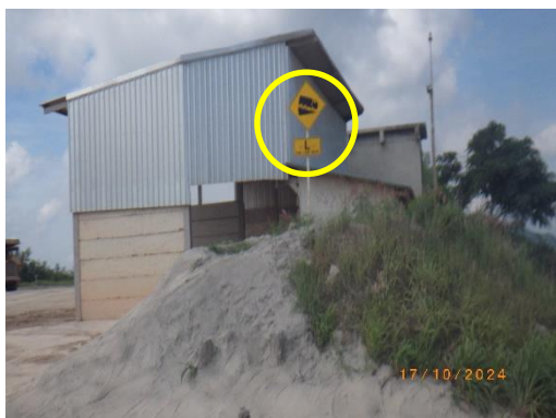
รูปที่ 2-43 ป้ายชะลอความเร็ว

ของบริษัท ทีพีโอ โพลิน จำกัด (มหาชน) ระหว่างเดือนกรกฎาคม-ธันวาคม พ.ศ. 2567