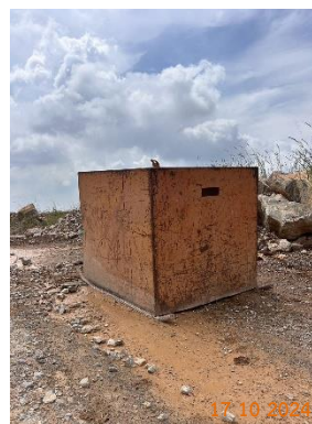
รูปที่ 2-5 ที่กำบังในการหลบขณะระเบิด