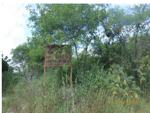
รูปที่ 2-10 โครงการฟื้นฟูเหมือง (ในแนวเขตเว้นการทำเหมือง)