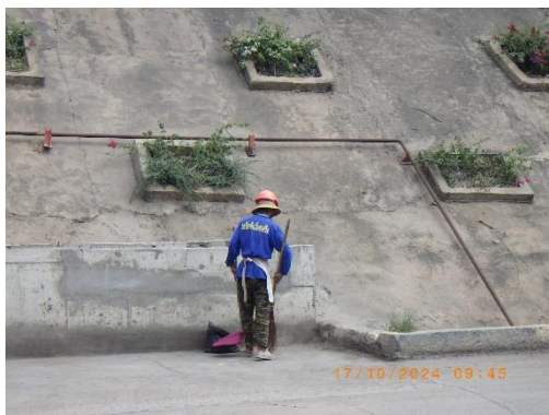
รูปที่ 2-35 พนักงานทำความสะอาดลานซีเมนต์ บริเวณโรงงานปูนซีเมนต์

ของบริษัท ทีพีโอ โพลิน จำกัด (มหาชน) ระหว่างเดือนกรกฎาคม-ธันวาคม พ.ศ. 2567