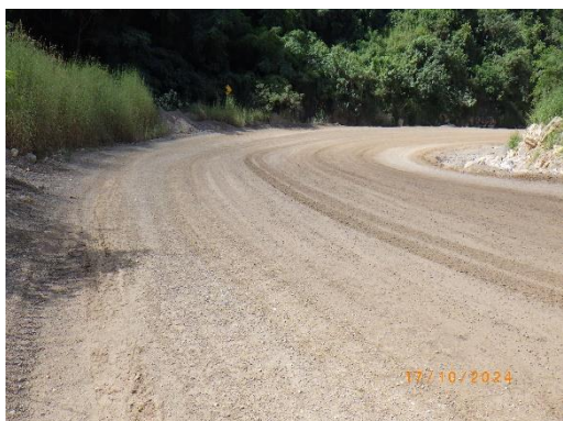
รูปที่ 2-23 ใช้ประโยชน์มูลดินในการปรับปรุง ไหล่ทาง และเส้นทางบริเวณหน้าเหมือง