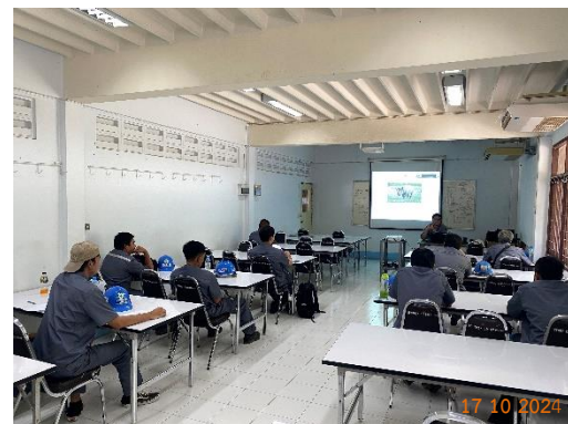
รูปที่ 2-40 การอบรมพนักงานขับรถบรรทุกแร่