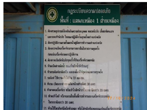
รูปที่ 2-19 ประกาศข่าวสารในพื้นที่เหมือง